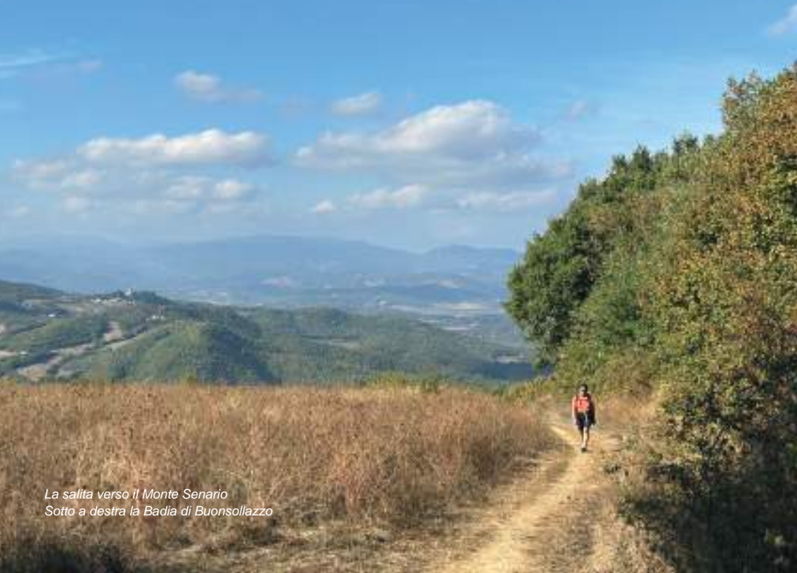
La salita verso il Monte Senario Sotto a destra la Badia di Buonsollazzo