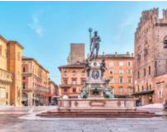
Piazza Maggiore con la statua di Nettuno

Partiamo alle 11:00 in punto e passando per Via D'Azeglio, dove abitava Lucio Dalla, si raggiunge Via Saragozza. La si percorre interamente oltrepasando l'omonima