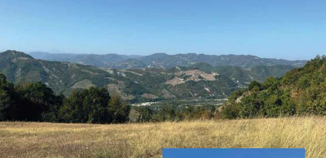
Vista sulle colline che sovrastano Sasso Marconi e la piana dei Prati di Mugnano

A differenza degli intrepidi ciclisti, noi preferiamo la più comoda strada che porta a Brento, dove sostiamo alcune ore nei pressi del Centro sportivo, prima di riprendere il lungo tratto che collega Brento a Monterumici e poi Monzuno. Il percorso pedestre corre in gran parte parallelo alla strada asfaltata, ma sempre in mezzo alla natura. Qui ti accorgi che alla «Via degli Dei» ci tengono molto, perché sia nei paesini che nei boschi e praterie sono numerose le insegne che pubblicizzano le varie strutture ricettive.