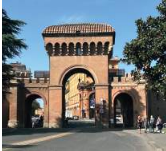
In alto a destra la Porta Saragozza dove ha inizio il porticato che porta al Santuario di San Luca

porta, dalla quale inizia il Porticato di San Luca. Quest'ultimo, lungo 3.7 km, è il porticato continuo più lungo d'Europa. I 666 portici conducono in piano fino all'arco del Meloncello e poi in salita fino al Santuario della Beata Vergine di San Luca, dove arriviamo dopo 1h30 ore di cammino. La chiesa si eleva sul Colle della Guardia, a 280 metri s.l.m., da dove si ha una stupenda vista sulla sottostante città di Bologna e dei suoi dintorni. Il suo aspetto attuale è frutto di interventi di stampo barocco del XVIII secolo.