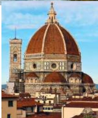
I due simboli di Firenze: Ponte Vecchio in alto e la Cupola del Brunelleschi