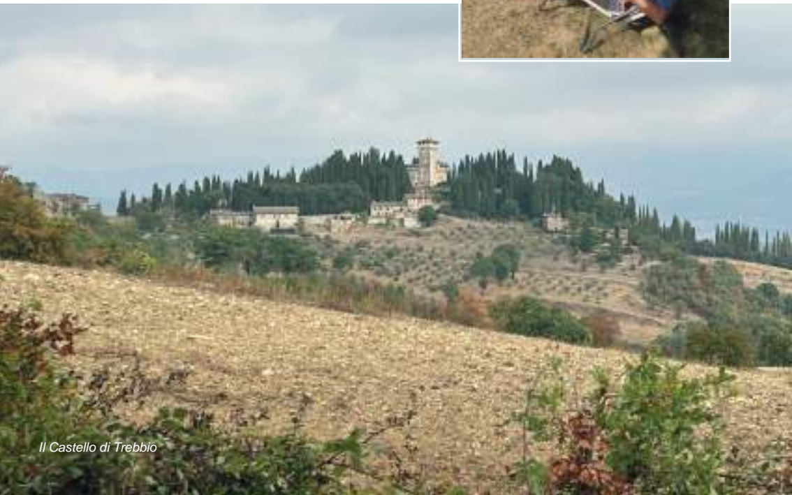
Il Castello di Trebbio