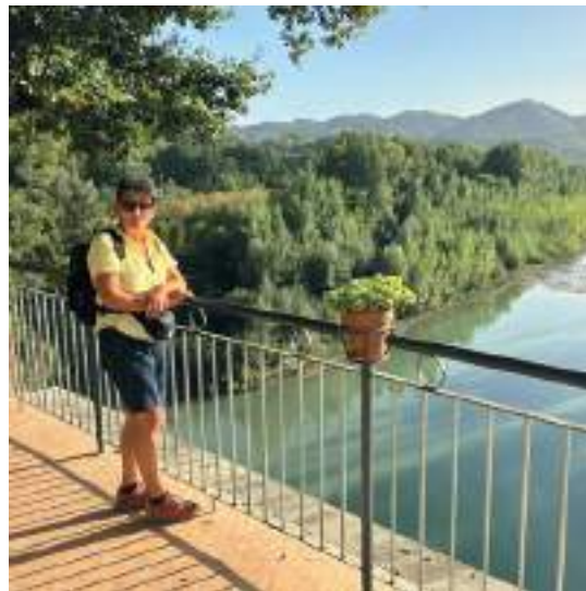
La prima parte del percorso attraversa il Parco Naturalistico di San Gherardo costeggiando il fiume Reno

E' già abbastanza tardi e decidiamo di proseguire fino alla località di Sasso Marconi, situata poco distante sull'altra sponda del fiume. Lasciata l'Oasi Naturalistica di San Gherardo, incrociamo la statale che porta verso la cittadina nota per aver dato la nascita al celebre politico e inventore del telegrafo senza fili. Camminando a lato della trafficatissima arteria attraversiamo il lungo ponte che passa sopra il fiume Reno e l'Autostrada A1 e raggiungiamo la stazione ferroviaria dove giungiamo alle ore 18:00. Trovato alloggio in un modesto albergo in centro, dopo una rinfrescante doccia, ceniamo nell'unica trattoria che troviamo aperta (lunedì è giorno di riposo). La ricerca però è stata appagante: il menu propostoci contemplava prosciutto di Langhirano con burrata, risotto al gorgonzola e spinaci, cantucci al Vin Santo, il tutto ad un prezzo irrisorio.