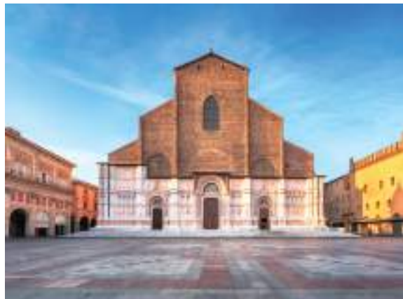
La Basilica di San Petronio, patrono di Bologna