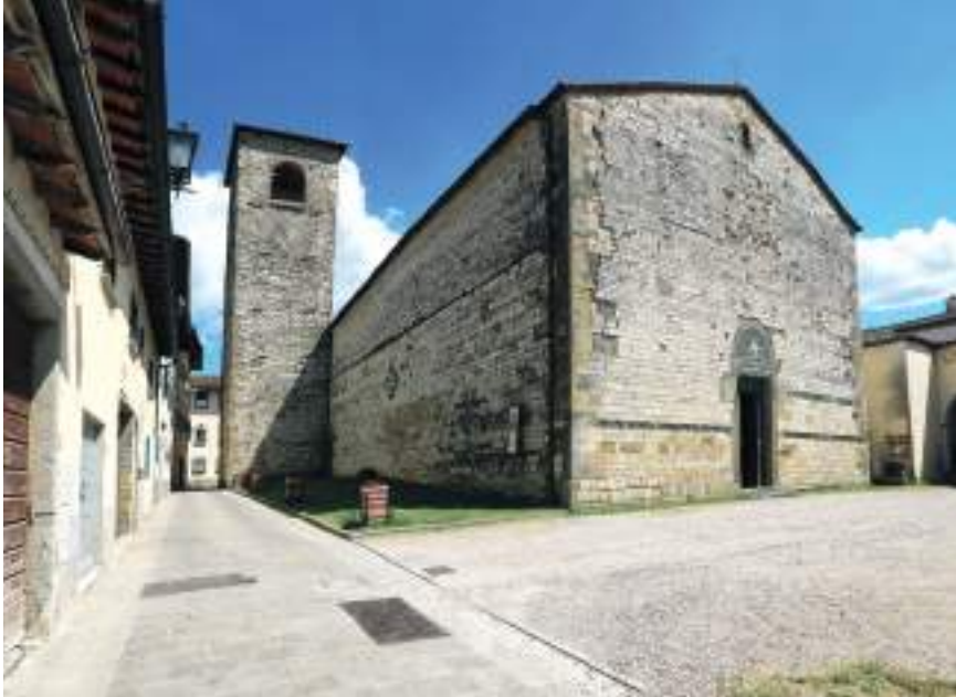
L'antica Pieve di Sant'Agata

Si fa sera e stancamente ci incamminiamo lungo la strada che porta all'uscita del paese. Improvvisamente ci viene incontro un autobus con la scritta «San Piero a Sieve». Sebbene non ci troviamo in una fermata ufficiale, l'autista capisce subito la nostra situazione e, forse colpito da un momento di compassione, ci fa salire a bordo. Siamo i soli passeggeri. In un attimo arriviamo in centro paese di San Piero a Sieve e subito troviamo un accogliente B&B.