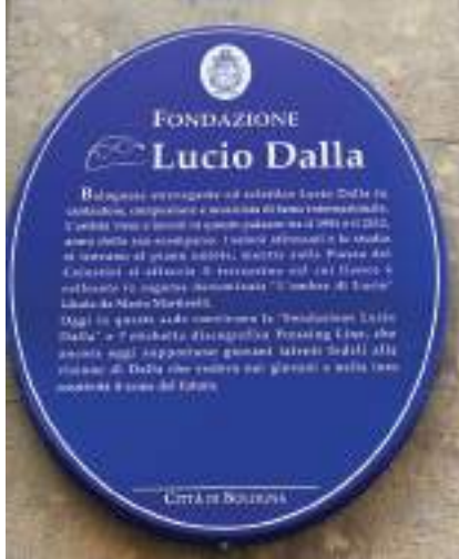
Sopra l'insegna ricordo sulla casa di Lucio Dalla