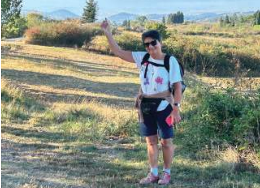
Gisa indica soddisfatta la cupola del Duomo di Firenze in lontananza