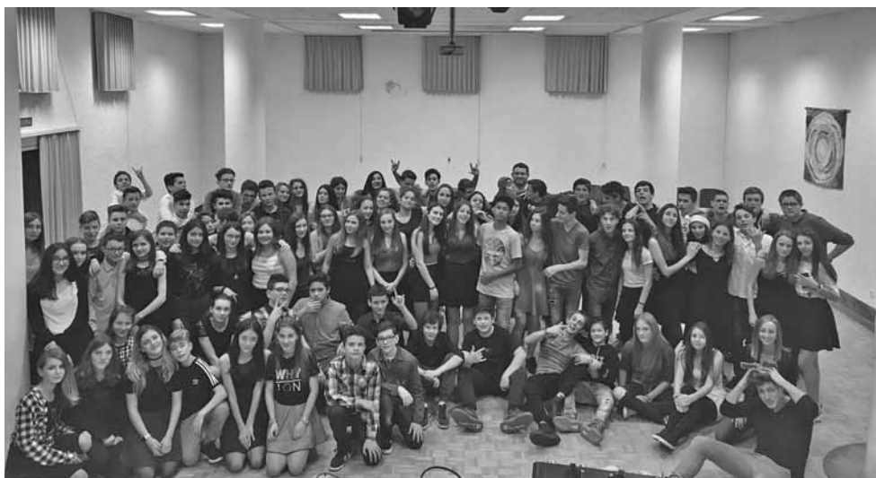
Venerdì 14 dicembre: festa per gli scolari delle superiori in centro parrocchiale