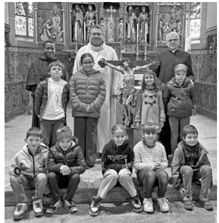
Sopra Sabato 15 aprile: prima Confessione