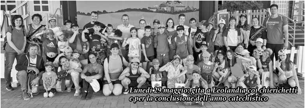
Lunedì 29 maggio: gita a Leolandia coi chierichetti e per la conclusione dell'anno catechistico