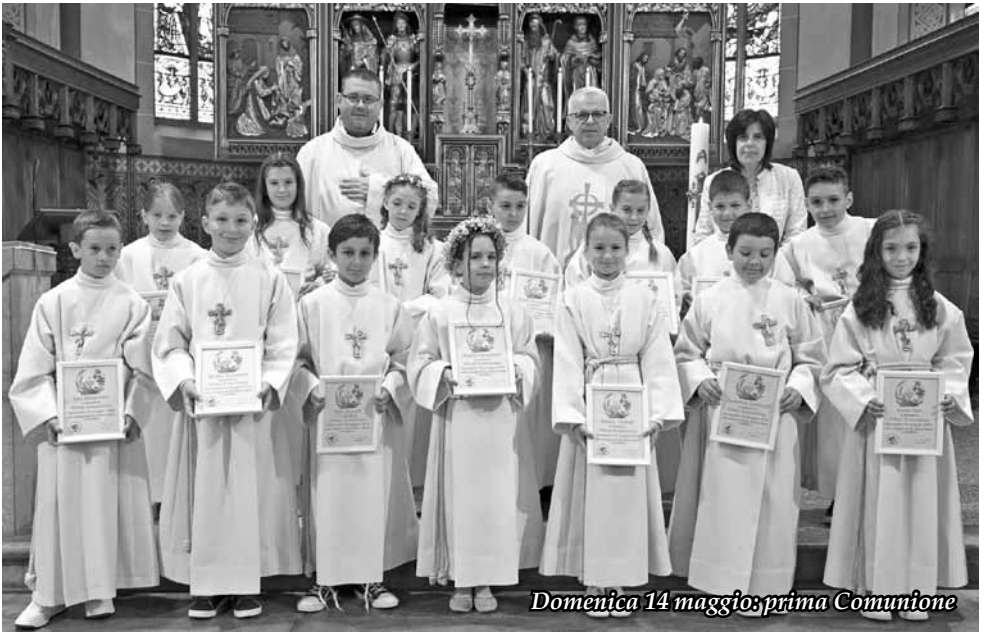
Domenica 14 maggio: prima Comunione